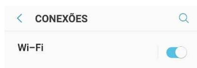
Figura 3 – Rede Wi-Fi