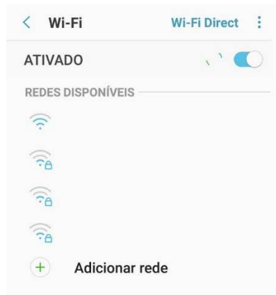
Figura 4 – Adicionar rede manualmente