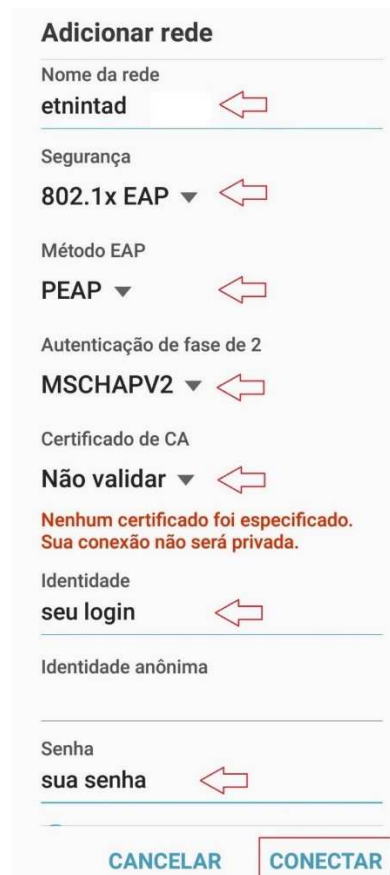
Figura 5 – Configurações para acesso à rede etnintad